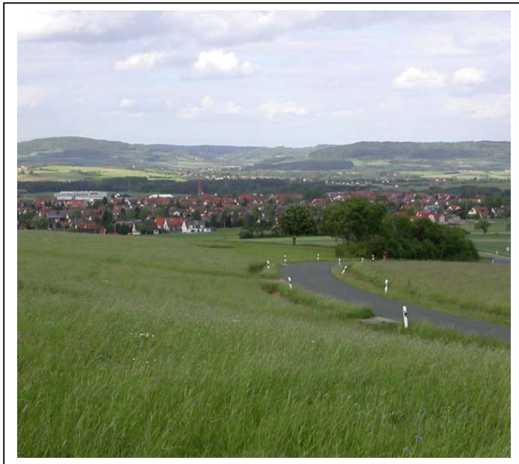
Blick vom Kalchreuther Liaszug über die Gemeinde Eckental hinweg auf den Juratrauf.

Mit der heutigen Exkursion betritt der Verein zur Erforschung der Flora des Regnitzgebietes wieder einmal Neuland. Es handelt sich nicht um eine der traditionellen Kartierungsexkursionen. Im Mittelpunkt steht heute die Erfassung punktgenauer Pflanzenfundorte durch ein GPS-Gerät, ebenso wie das Wiederauffinden bereits bekannter Pflanzenvorkommen durch das Erstellen einer Route (routes). Das Übertragen der gewonnenen Daten auf einen Rechner wird demonstriert. Dabei wird die Wegeaufzeichnung (track) sowohl auf TOP 50 als auch auf Google Earth plus vorgenommen. Die unterwegs an den Pflanzenfundorten gewonnenen Wegpunkte (waypoints) werden integriert. Es werden Pflanzenprofile erstellt und abgespeichert. Die Übertragung der gewonnenen Koordinaten in eine Excel- Datei mit dem Pflanzenbestand des Meßtischquadranten rundet die Demonstration ab. Die Einführung in die GPS-Technologie, sowie das praktische Arbeiten im Gelände und am Rechner übernimmt Herr Martin Vogt von der Firma GPS + Teleskop Vogt, Hauptstraße 77, 90562 Heroldsberg, Tel. 0911-56149974.